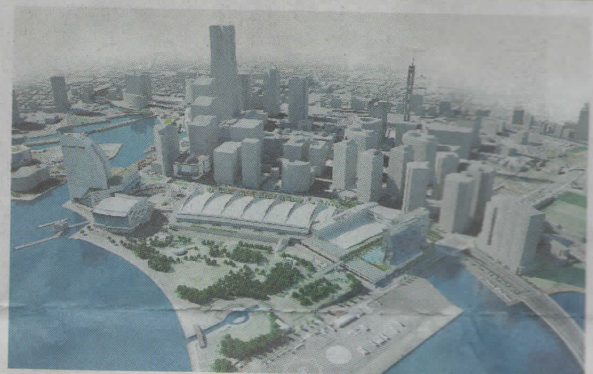
ビルが整備される

パシフィコ横浜は、訪日外国人向けに横浜高島屋とのコラボで日本文化を体験してもらうプログラムを開発するなど、おもてなしプランを多角的に展開している。今後は実証実験の成果を踏まえ、市域全体を視野に鉄道事業者と連携した回遊性向上の在り方を検討していく考えだ。