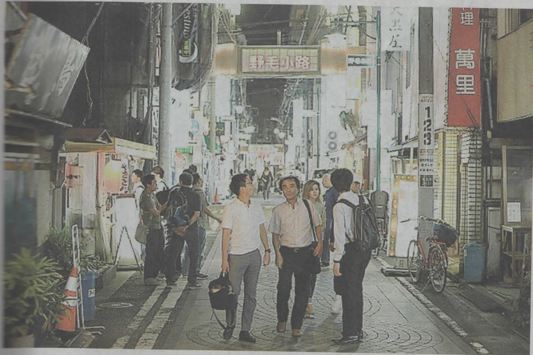
昭和の風情が残る野毛地区に合わせたおもてなしの美意識を「野毛のまち歩き」

横浜ノース)の来春開業を控え、パシフィコ横浜が、MIC E (国際会議や展不会など) 参加者向けに、横浜の地域特性を生かした「おもてなし」の取り組みを強化している。MIC E誘致の競争が国境を越えて激しさを増す中、コンベンション施設のある都市では歴史や文化、公共空間など地域の特色を演出する「ユニークベニュー」を積極的に展開。横浜ならではのアフターMIC Eプラントとは。 (宮崎 功一)